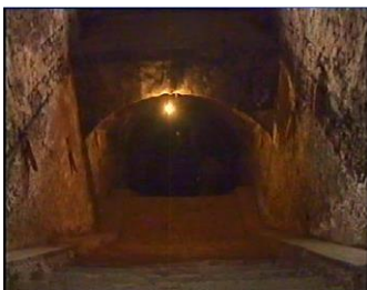
Închisoarea comunistă Jilava. Intrarea spre celulele subterane.

Nu vă putem spune cuvintele formale obișnuite „Crăciun fericit”, deoarece știm despre crime asupra creștinilor care au loc în țările comuniste și despre planificarea crimelor în masă în întreaga lume. Acum, când aduci bucurie copiilor din jurul tău, iată ce a publicat chiar și o revistă sovietică comunistă ateistă pentru a combate educația religioasă pe care părinții creștini o oferă copiilor lor în perioada comunismului. Editorul îi batjocorește pe părinții credincioși, dar este obligat să publice o mărturie uimitoare despre copiii creștini ruși care sfidează învățătura comunistă și atee. Astfel, Nauka I Religia din iulie 1969 nu poate explica ce a spus Yuri, un băiat de 12 ani: „În rugăciunile mele, îi cer lui Dumnezeu să-mi dea putere să lupt cu cei care sunt împotriva lui Dumnezeu. Trebuie să ne luptăm cu ei nu cu sabia, ci cu Biblia.” Un alt băiat de aceeași vârstă spune: „Îl rog pe Dumnezeu să-mi ierte păcatele, să mă întărească și să nu existe rău în mine”.