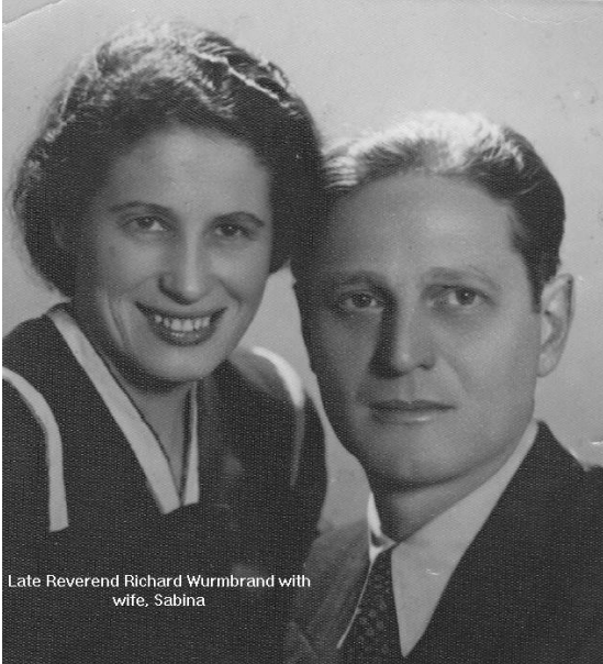
Late Reverend Richard Wurmbrand with wife, Sabina

Ajutăm orfani și creștini în vârstă (mulți cu vârste peste 80, 90 de ani) care au fost închiși pentru credință în actuale și foste țări comuniste. În aceste momente critice ajutăm refugiați creștini din Ucraina!