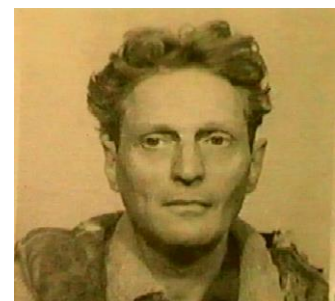
Fotografie a pastorului Richard Wurmbrand în timpul detenției la Jilava