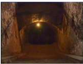
Închisoarea comunistă Jilava, Intrarea spre celulele subterane.

5.000 de persoane au fost martorii miracolului lui Isus înmulțind puțină mâncare care a avut-o la îndemână. Isus era înconjurat de 12 apostoli. Totuși, în cele din urmă este scris că Domnul Isus este bucuros dacă se vor aduna 2-3 ucenici în Numele Lui. Iisus explică: "Adevărat, adevărat vă spun că Mă căutați nu pentru că ați văzut semne, ci pentru că ați mâncat din pâinile acelea și v-ați săturat." (Ioan 6:26). Mințile noastre caută un avantaj personal, mai degrabă decât a rămâne uimiți de miracolul lui Dumnezeu. Credința fraților noștri persecutați este un miracol care trebuie să ne lase uimiți.