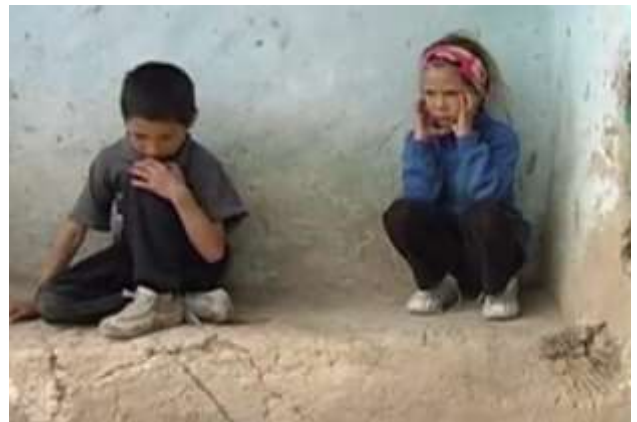
Copii pe podeaua murdară a unei case dintr-un sat românesc. România este a doua cea mai săracă țară din Uniunea Europeană!