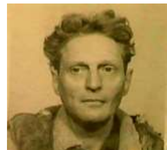
Fotografie a pastorului Richard Wurmbrand în timpul detenției la Jilava