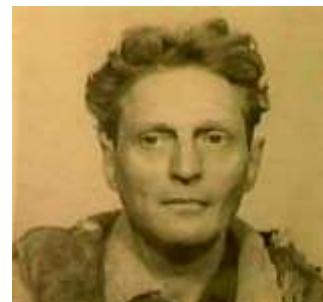
Fotografie a pastorului Richard Wurmbrand în timpul detenției la Jilava