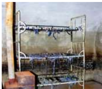
Celulă cu paturi suprapuse, fără saltele, pe care deținuții erau obligați să doarmă. Soba, doar de decor, niciodată încălzită în nopțile geroase de iarnă.