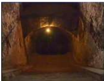
Închisoarea comunistă Jilava. Intrarea spre celulele subterane.

Este greșit să fii slab față de comunismul diavolesc. SERGHEI URALOV a fost unul din membrii echipei comuniste care l-a împușcat pe țarul rus și pe familia sa. El relatează cum în ultima sa zi, NICOLAI a spus: „I-am scris o scrisoare lui LENIN, amintindu-i că, în 1912, mama lui mi-a cerut să ușuresc soarta soarei lui LENIN, CARE A FOST DEPORTATĂ ÎN SIBERIA pentru că a răspândit literatură comunistă secretă. Am ordonat eliberarea ei și i-am dat posibilitatea să plece din țară. Acum, la rândul meu, îi cer lui LENIN o favoare, nu pentru mine, ci pentru fiul meu bolnav, ca să i se permită să fie cu niște rude din Sud.” URALOV i-a promis țarului că va înainta petiția, dar i-a împușcat toată familia în aceeași noapte. Împărăteasa l-a ținut în brațe pe prințul moștenitor și, chiar și după ce a fost rănită, s-a rugat lui Dumnezeu. Ea a căzut moartă acoperindu-și fiul cu trupul. Prințesele au încercat să se apere cu perne. Țarul a primit moartea în liniște, în tăcere. ("NOVOIE RUSSKOIE SLOVO", 30 ianuarie 1977.) Fiți înțelegători cu comuniștii și ei vă vor recompensa cu gloanțe.