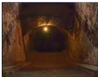
Închisoarea comunistă Jilava. Intrarea spre celulele subterane.