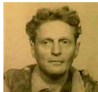
Fotografie a pastorului Richard Wurmbrand în timpul detenției la Jilava