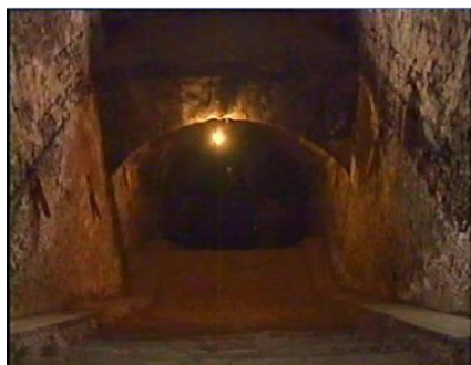
Închisoarea comunistă Jilava. Intrarea spre celulele subterane.