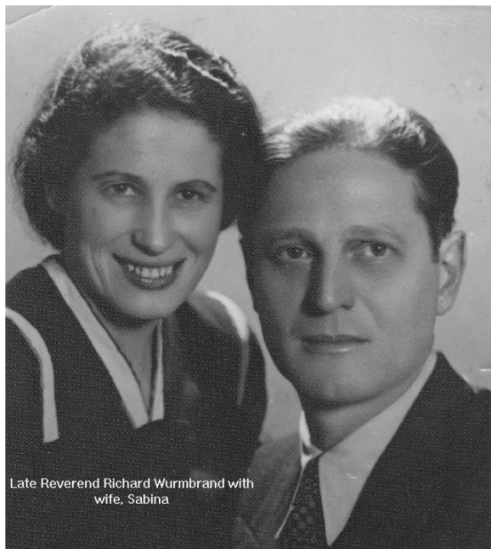
Late Reverend Richard Wurmbrand with wife, Sabina

Asociația Creștină Sabina Wurmbrand Căsuța Poștală 12, OP 74 București, 062580, România Email: apel@asociatiacrestinasabinawurmbrand.ro ; Pagina Web: asociatiacrestinasabinawurmbrand.ro