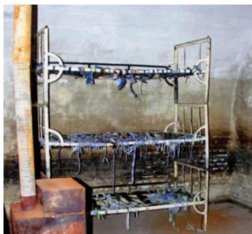
Celulă cu paturi suprapuse, fără saltele, pe care deținuții erau obligați să doarmă. Soba, doar de decor, niciodată încălzită în iernile geroase.