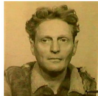
Fotografie a pastorului Richard Wurmbrand în timpul detenției la Jilava