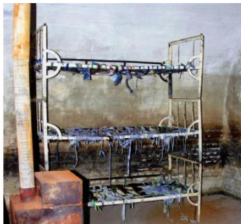
Celulă cu paturi suprapuse, fără saltele, pe care deținuții erau obligați să doarmă. Soba, doar de decor, neîncălzită în nopțile geroase de iarnă