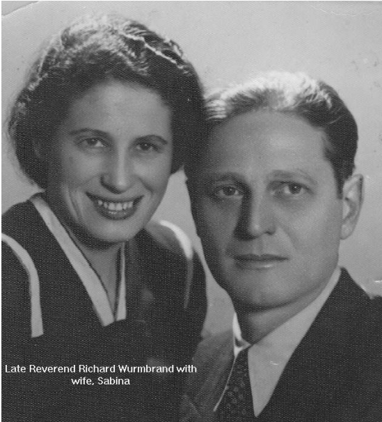
Late Reverend Richard Wurmbrand with wife, Sabina

Ajutăm orfani și creștini în vârstă (mulți cu vârste peste 80, 90 de ani) care au fost închiși pentru credință în actuale și foste țări comuniste. În aceste momente critice ajutăm refugiați creștini din Ucraina!