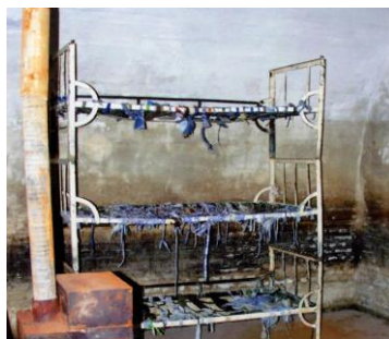
Celulă cu paturi suprapuse, fără saltele, pe care deținuții erau obligați să doarmă. Soba, doar de décor, niciodată încălzită în noaptele geroase de iarnă