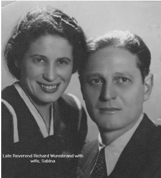
Late Reverend Richard Wurmbrand with wife, Sabina

Ajutăm orfani și creștini în vârstă (mulți cu vârste peste 80, 90 de ani) care au fost închiși pentru credință în actuale și foste țări comuniste. În aceste momente critice ajutăm refugiați creștini din Ucraina!