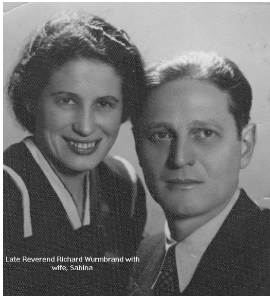
Late Reverend Richard Wurmbrand with wife, Sabina

Ajutăm orfani și creștini în vârstă (mulți cu vârste peste 80, 90 de ani) care au fost închiși pentru credință în actuale și foste țări comuniste. În aceste momente critice ajutăm refugiați creștini scăpați din Ucraina!