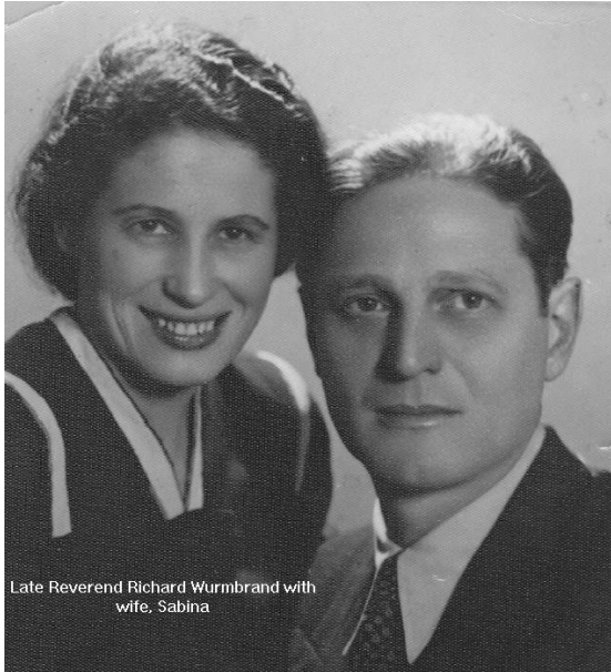
Late Reverend Richard Wurmbrand with wife, Sabina

Ajutăm orfani și creștini în vârstă (mulți cu vârste peste 80, 90 de ani) care au fost închiși pentru credință în actuale și foste țări comuniste. În aceste momente critice ajutăm refugiați creștini din Ucraina!