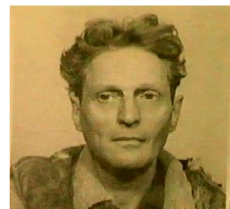
Fotografie a pastorului Richard Wurmbrand în timpul detenției la Jilava