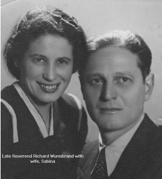
Late Reverend Richard Wurmbrand with wife, Sabina

Ajutăm orfani și creștini în vârstă (mulți cu vârste peste 80, 90 de ani) care au fost închiși pentru credință în actuale și foste țări comuniste. În aceste momente critice ajutăm refugiați creștini din Ucraina!