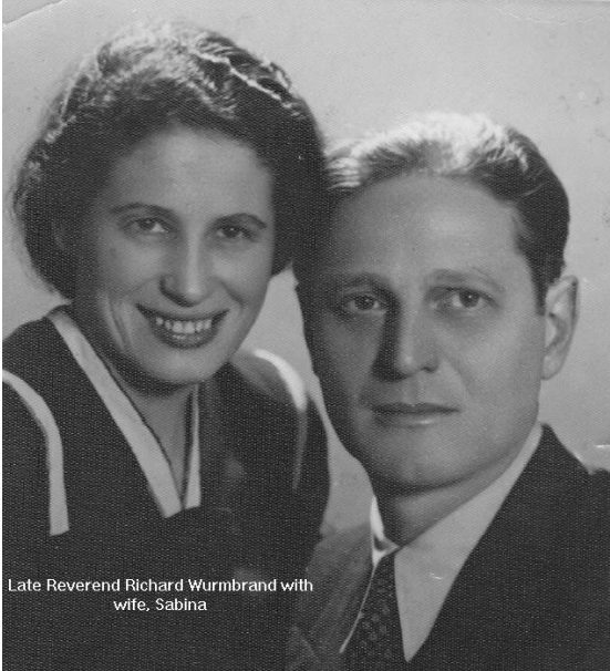
Late Reverend Richard Wurmbbrand with wife, Sabina

Anunț! Se pot obține următoarele 5 cărți gratuite, numai folosind Formularul de Cerere de pe pagina de internet: